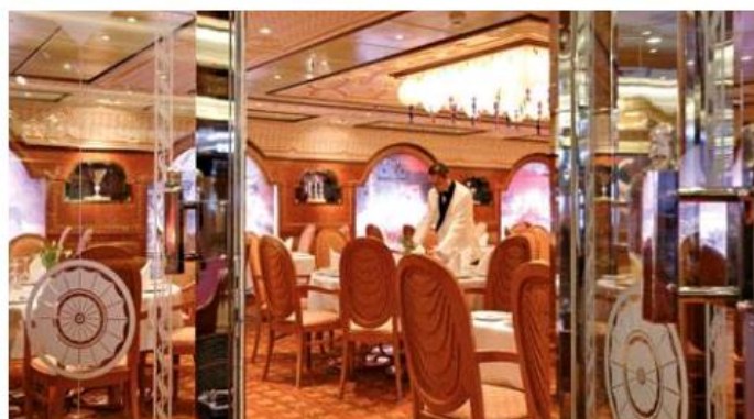
En bas - Restaurant degli Argentieri