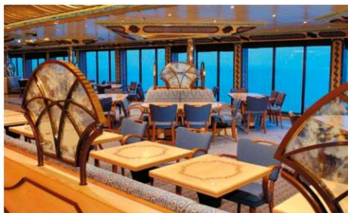
En haut - Restaurant Buffet Perla del Lago